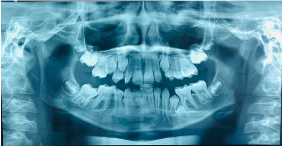
Figuras 3A, 3B e 3C: Paciente apresentando apinhamento, com relação de molar esquerdo classe III, perda precoce do dente 75, dente 35 retido sem espaço para erupcionar e que possui padrão facial I.