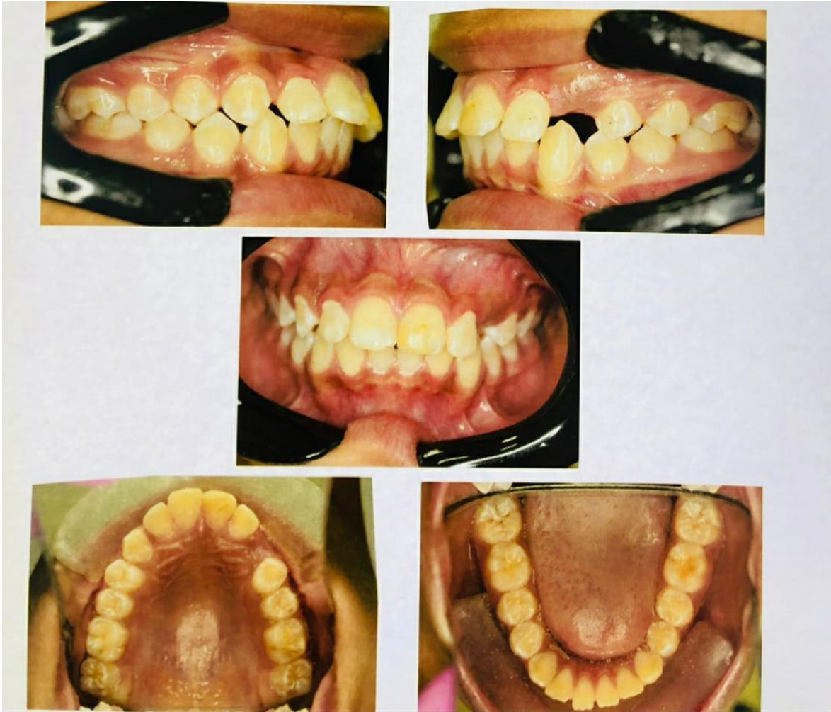
Figura 2: Paciente apresentando overjet acentuado e que possui padrão facial II.

Quanto ao padrão facial, como podem ser observados no gráfico 2, 7 dos 10 adolescentes, ou seja, 70% apresentaram o Padrão Facial I, enquanto 2 (20%) apresentaram o Padrão Facial II e 1 (10%) apresentou o Padrão Facial III. Não foram encontrados os padrões do tipo face longa e face curta. Ao avaliar os resultados obtidos na pesquisa podemos observar predomínio do padrão facial I e uma menor frequência o padrão III. Tal resultado pode ser comprovado pelo autor Silva Filho et al. (2008) que apresentou os mesmos índices dos padrões em sua pesquisa, além disso, ele relata que crianças que possuem o padrão facial I crescem e chegam a idade adulta com esse mesmo padrão e que o padrão facial I é uma morfologia adequada e mais harmônica para os padrões de beleza da atualidade.