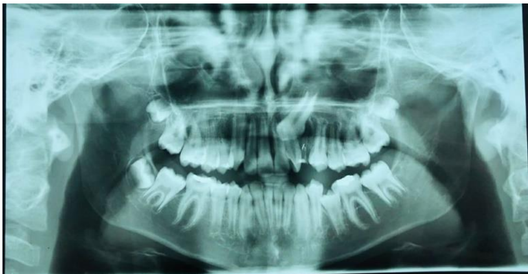
Figura 4: Paciente apresentando mordida cruzada, dente 22 girovertido, dente 23 retido, dente 35 sem espaço para erupcionar por completo e que possui padrão facial I.