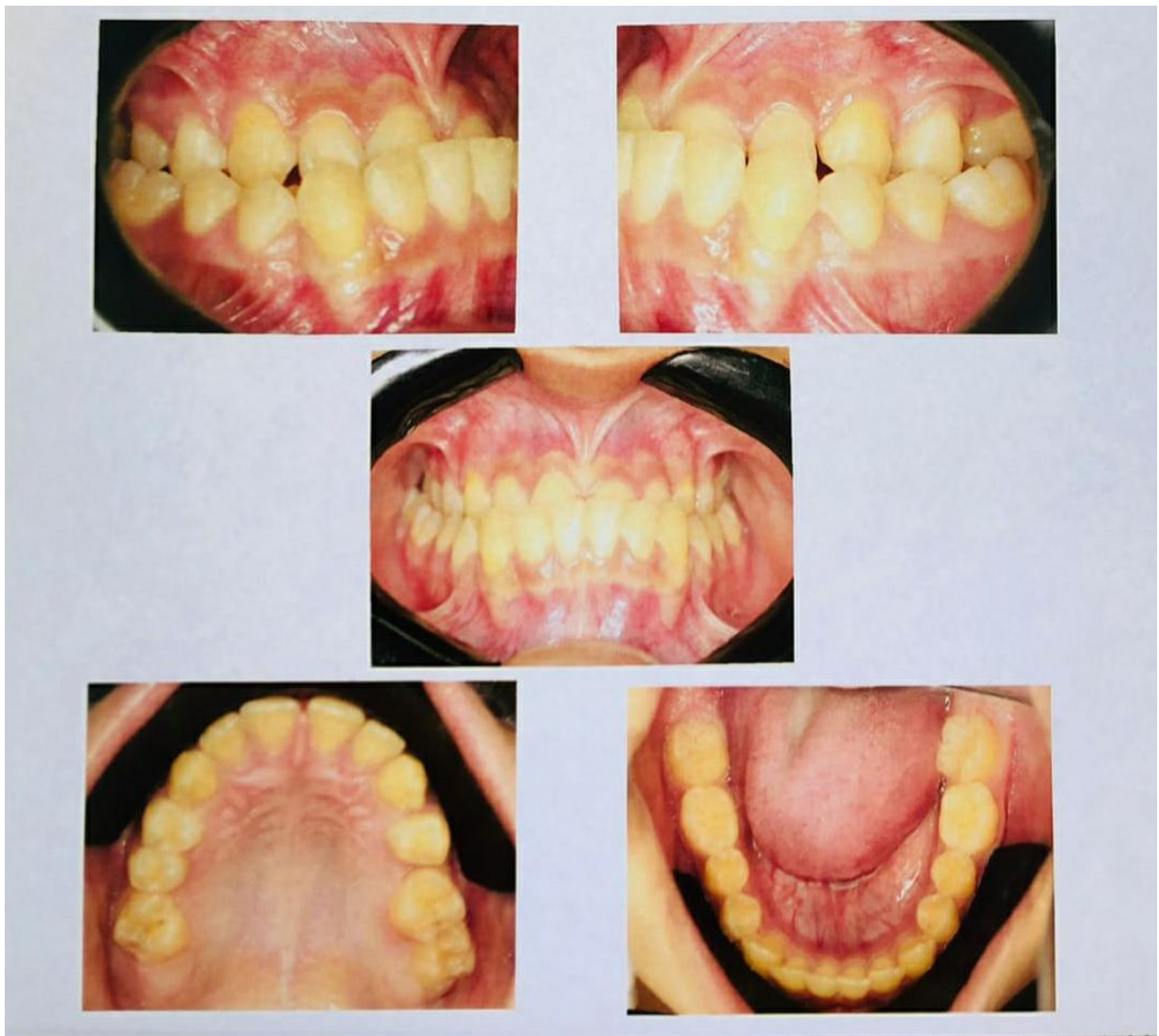
Figura 1: Paciente apresentando mordida cruzada total, mordida cruzada bilateral posterior e que possui o padrão facial III.