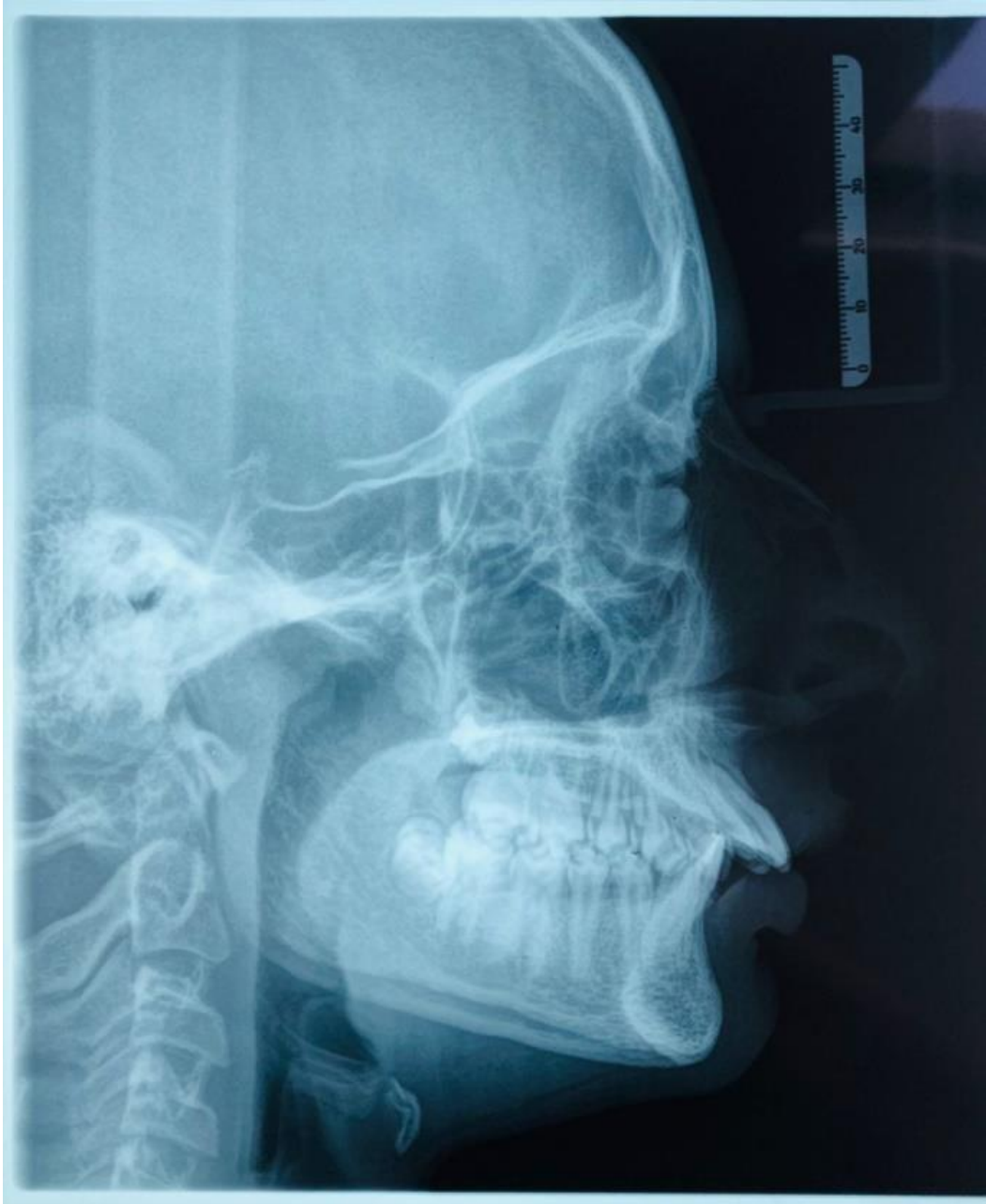
Figura 5: Paciente apresentando mordida cruzada, overjet acentuado com vedamento labial passivo ausente e que possui padrão facial II.

Os dentes retidos são aqueles que não erupcionaram no momento adequado e se encontram em sua totalidade no osso maxilar ou mandibular. Geralmente se encontram nessa situação devido a fatores fisiológicos ou patológicos e podem ser identificados através da radiografia, sendo a panorâmica a mais comumente utilizada e a tomografia computadorizada a mais precisa para casos de necessidade cirúrgica (PRIMO, et al., 2011).