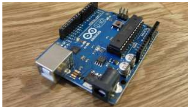
FIGURA 1 – Arduino

desenvolvimento de soluções personalizadas e de baixo custo, que podem ser facilmente integradas a outros dispositivos domésticos. Ao utilizar sensores e atuadores conectados a uma rede doméstica, o Arduino pode controlar diversos aspectos de uma residência, como iluminação, climatização e segurança. Esses sistemas são programáveis, o que significa que podem ser ajustados para atender às necessidades específicas dos usuários, aumentando a flexibilidade e a eficiência da automação residencial. A FIGURA 1 ilustra um modelo de plataforma de desenvolvimento do Arduino.