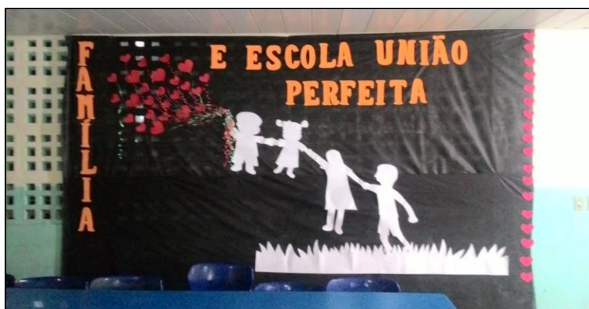
Foto 3 - Projeto Família na Escola - EMEF Girassol, Serra/ES.

Os desafios enfrentados pela EMEF Girassol se referem ao estilo de vida das famílias dos alunos. As famílias que são constituídas por pessoas que moram na Zona Rural do município da Serra em sua maioria. O sustento das famílias vem do trabalho agrícola braçal principalmente aragem do solo, plantio e colheita do café, bem como da pesca e sua comercialização.