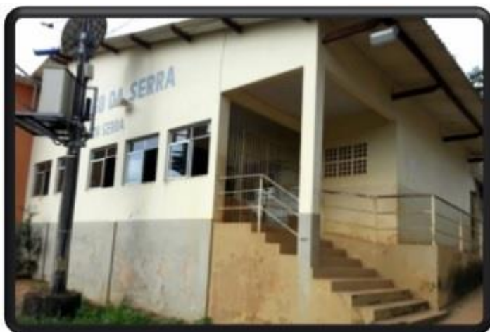
Foto 1 - Classe "Santiago", Serra/ES.