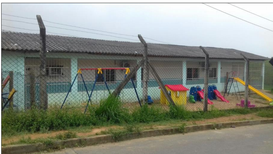
Foto 1 - Parquinho da EMEF Girassol, Serra/ES.

Em nosso primeiro contato com a EMEF Girassol o que nos chamou atenção foi ver o parquinho com brinquedos bem na frente da escola, onde o professor de Educação Física deixava as crianças brincarem e sempre estava por perto mediando algumas atividades. Por meio das brincadeiras os alunos não desenvolvem apenas a sua capacidade física, mas, também as suas competências emocionais e sociais.