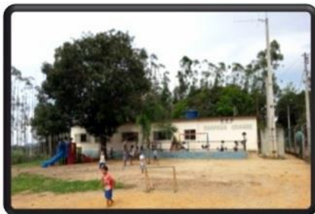
Foto 6 - Classe "Chapada Grande", Serra/ES.