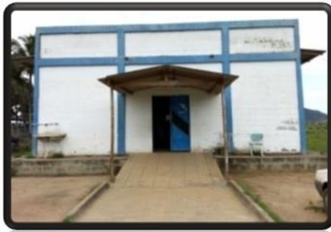
Foto 4 - Classe "Morro da Palha", Serra/ES.