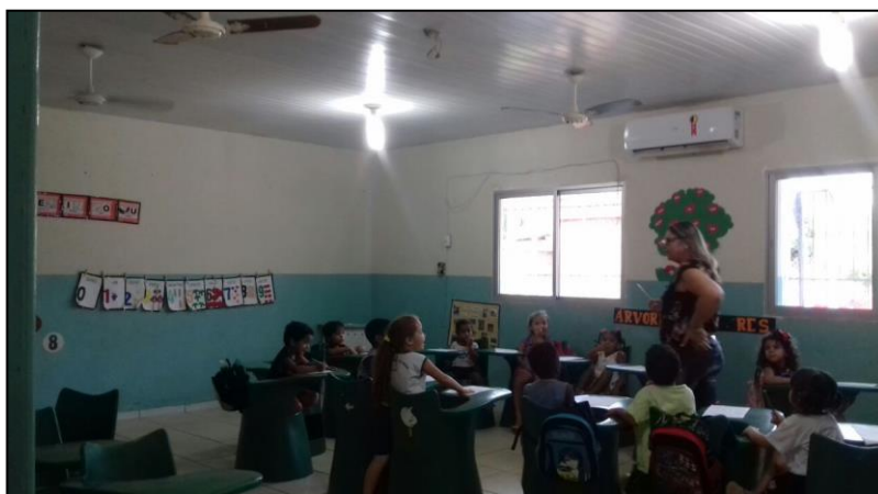
Foto 2 - Sala de Aula da EMEF Girassol, Serra/ES.

O trabalho escolar é uma ação de caráter coletivo realizado a partir da participação conjunta e integrada dos membros de toda comunidade escolar. A modalidade de gestão participativa entendida como envolvimento de todos os que fazem parte, direta ou indiretamente, do processo educacional. Sendo assim, os membros da comunidade escolar contribuem para o estabelecimento de objetivos; a solução de problemas; a tomada de decisões; a proposição, implementação, monitoramento e