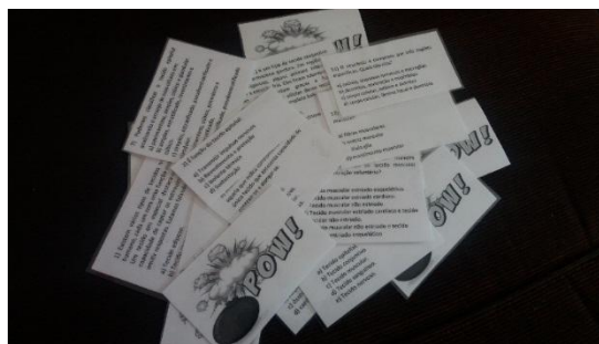
Figura 2 - Cartas com perguntas e figuras elaboradas para criação do jogo.