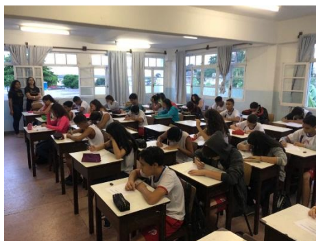
Figura 3. Aplicação dos questionários.