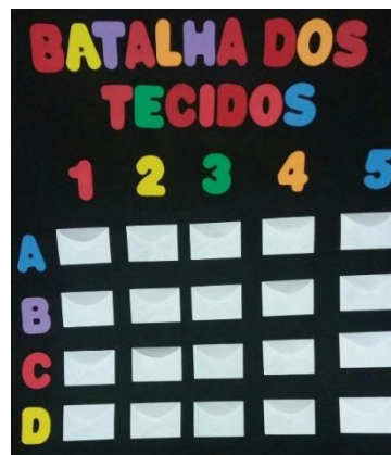
Figura 1 – jogo didático confeccionado

Em seguida, foi realizada a aplicação do jogo onde os alunos foram divididos em 2 grandes grupos. Cada grupo, na sua vez, tinha direito de escolher uma letra e um número na grade do jogo. Se no envelope escolhido tivesse uma pergunta, o grupo ganhava o direito de resposta, em caso de acerto o grupo ganhava um ponto. Se errasse, a vez seria passada para o grupo adversário. Caso o envelope escolhido pelo grupo tivesse a figura de uma bomba, este perderia um ponto e passaria a vez. Ao final do jogo, foram entregues 2 caixas de bombons para o grupo vencedor.