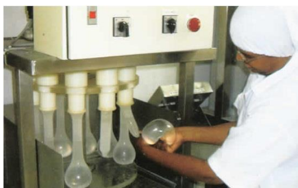
Imagem 1 – Equipamento de orifício

8º. Análise: são separados em mini lotes de quinze quilos até que todo o lote esteja completo, onde aguardam coleta de amostras para ensaios no laboratório. Nesse momento, se aprovado segue o processo, se não, o mini lote é refugado.