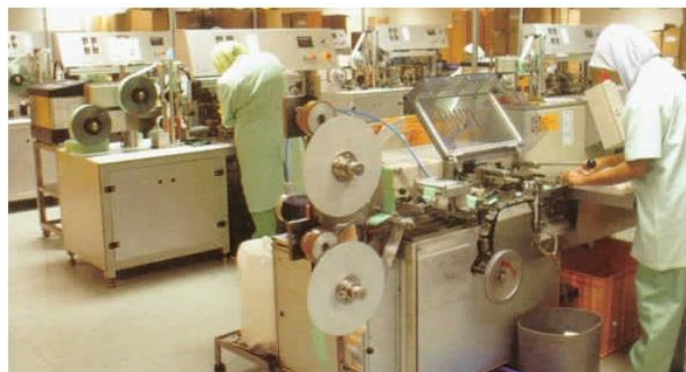
Imagem 4 – Máquina de embalagem primária

12º. Máquina de embalagem primária: o lote aprovado pelo controle de qualidade passa pela dosadora e recebem a quantidade ideal de lubrificante; em seguida, embalados no mesmo equipamento, são divididos em tiras de três ou oito conforme a necessidade. Também são impressos dizeres, como: data de fabricação, lote, etc. na própria embalagem. A imagem 4 mostra a máquina de embalagem primária.