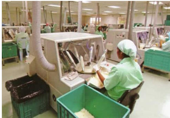
Imagem 2 – Teste elétrico

manual do preservativo em um molde de alumínio, como mostra a Imagem 2 abaixo: