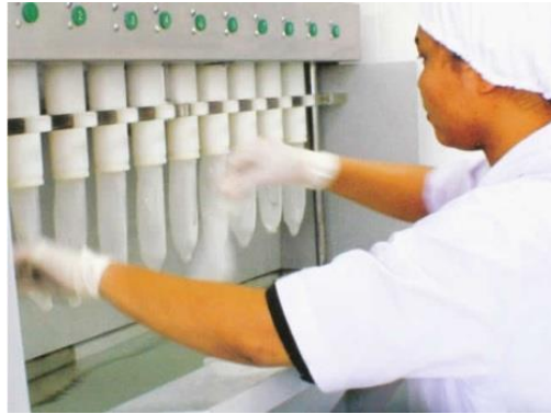
Imagem 3 – Teste de orifício