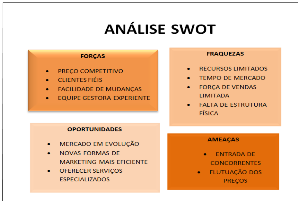
Fig. 7 – Análise Swot

Com o plano de negócios em andamento foi possível realizar uma análise SWOT para caracterizar os pontos fortes, fracos, oportunidades e ameaças da empresa. Com essa análise é possível valorizar as forças no mercado, melhorar nas fraquezas da empresa e assim, estabelecer metas em cima das oportunidades e ameaças que o mercado fornece.