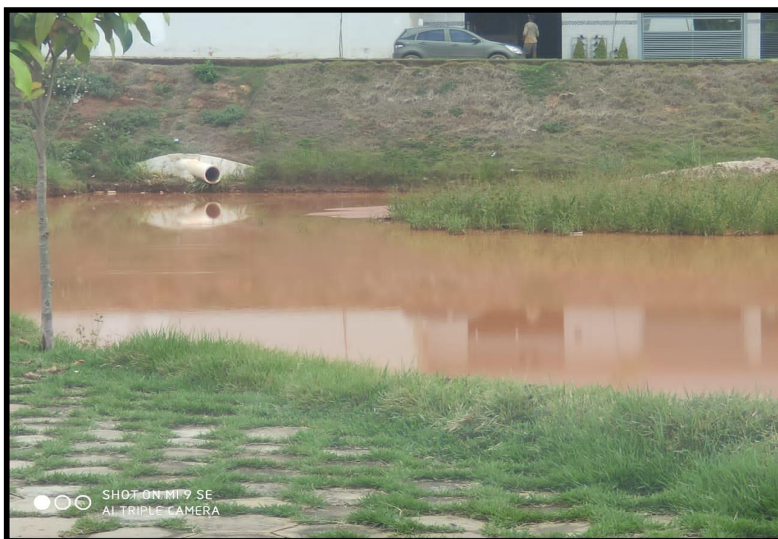
Figura 9 – Interior da lagoa de captação de água pluviais (Autores, 2019).

Na Figura 9, observa-se que existe na lagoa de captação de água pluvial, uma falta de manutenção da mesma, uma vez que em seu centro encontra-se um banco de areia e vegetação que deveriam ser removidos, demonstrando a falta de manutenção periódica. O banco de areia apresentado resulta na diminuição do armazenamento de água captada, além disso, existe o alagamento das ruas próximas, uma vez que, a lagoa conta com 3 entradas para o escoamento das águas e somente uma saída.