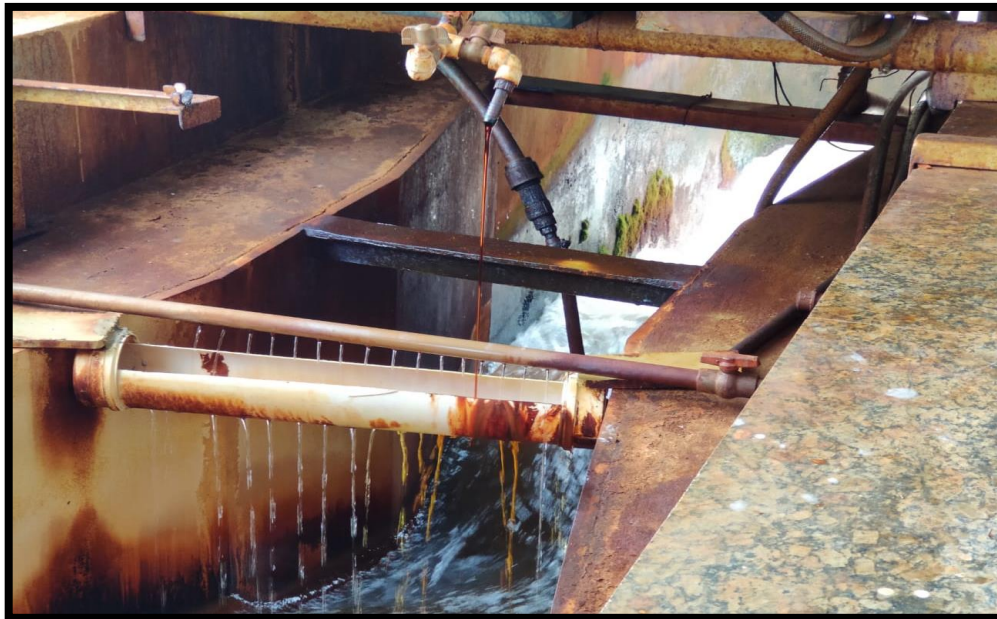
Figura 2- Processo de coagulação, momento em que se coloca o cloreto férrico na água captada (Autores, 2019).

A próxima etapa é a realização da floculação como é exemplificado na Figura 3, esse processo conta com o armazenamento da água para separação das partículas de sujeira, nessa etapa de tratamento da água, ela passa por tanques com uma velocidade reduzida, para que se possa realizar o processo de filtração e destinação final para o reservatório. De acordo a COPASA são coletadas amostras da água nas pontas de distribuição em um intervalo de 2 horas, com o intuito de verificar suas características físico-químicas e identificar erros no processo de tratamento.