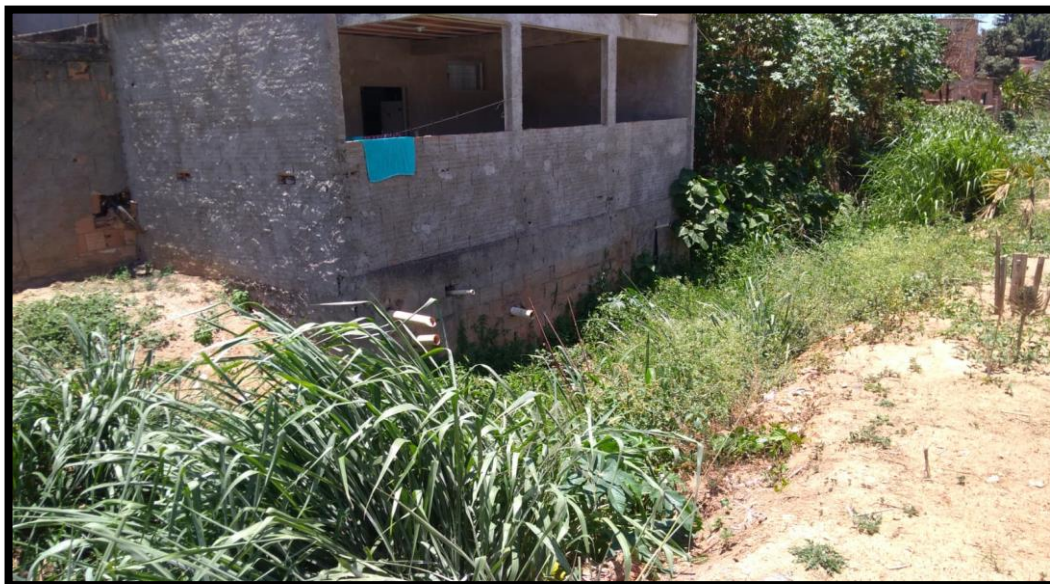
Figura 6 – Descarte inadequado do esgoto domestico Rua Ervino Hermann Preisell (Autores, 2019)

Dessa maneira, pode-se destacar que houve uma preocupação para se desenvolver um projeto eficaz para o residencial, bem como para a sua implantação, no entanto, nas residências que fazem divisa com o residencial, não se houve uma preocupação no melhoramento da rede coletora, haja vista que, todos os maléficos, da existência do descarte inadequado do esgoto doméstico prejudicam todos os moradores daquela região.