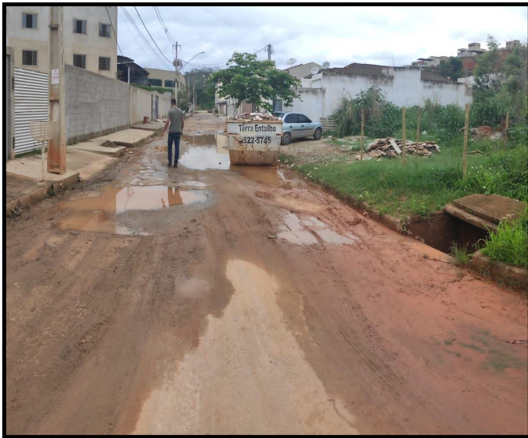
Figura 10 – Situação de uma das ruas do residencial após um dia de chuva (Autores, 2019).

Na Figura 10, verifica-se a existência de lama na via pública, evidenciando a existência de erosão de taludes próximos à rua e/ou nas partes mais altas do residencial, tendo em vista, que a erosão além assorear o córrego que passa pelo local, também pode entupir as bocas de lobo, que possuem como finalidade escoar as águas da chuva pelas sarjetas com destinação as galerias pluviais, onde o seu entupimento acarreta no alagamento das vias.