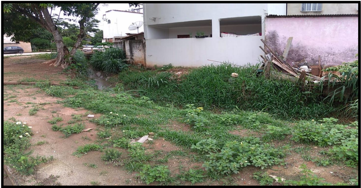
Figura 7 – Rua Ervino Hermann Preisell (AUTORES, 2019)

Segundo Leal (2008), apesar dos benefícios a saúde proporcionada pelo esgotamento sanitário, quando não feito de maneira adequada, pode acarretar na deterioração dos corpos receptores, além de possíveis vazamentos e poluição das redes coletoras, como é possível verificar na Figura 7.