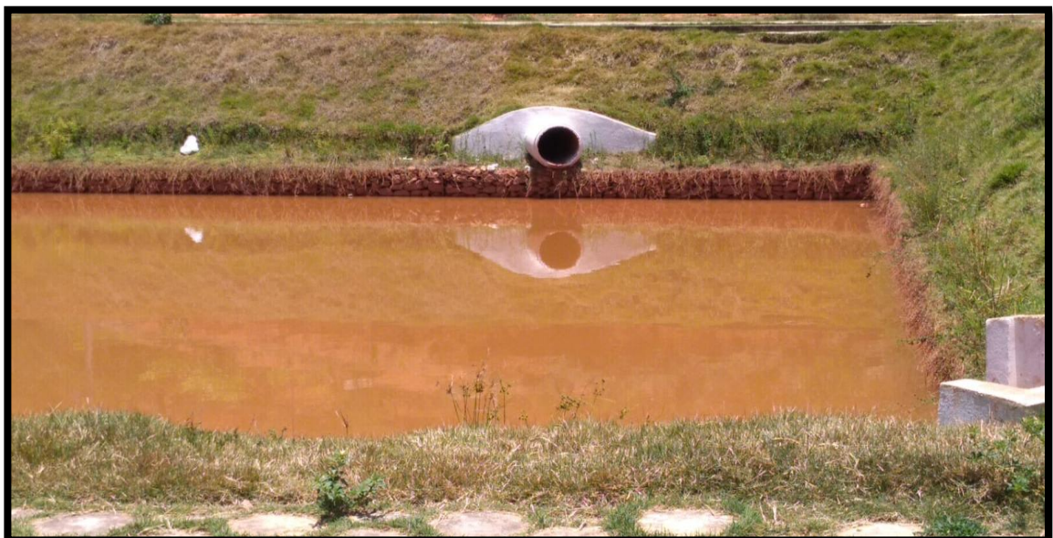
Figura 8 – Lagoa de captação de águas pluviais (AUTORES, 2019)

Como pode ser visto na Figura 8 abaixo, o Residencial Laranjeiras conta com uma lagoa de captação de águas pluviais, e de acordo com Junior & Peganni (2009) o objetivo das mesmas é minimizar impactos hidrológicos e controlar a vazão máxima, o volume e os materiais sólidos, onde as águas captadas pelas valas são destinadas a essa lagoa, evitando o alagamento e a infiltração.