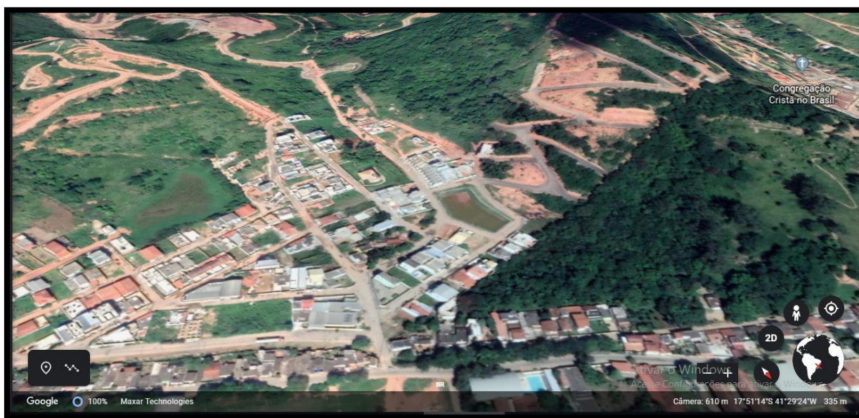
Figura 1 – Imagem Aérea do Residencial Laranjeiras

O residencial Laranjeiras como é mostrado na Figura 1, está localizado no perímetro do bairro São Jacinto. De acordo a empresa AEP Engenharia (2017), que foi a responsável pela infraestrutura do residencial, o mesmo possui uma área total de 168.332,20 m 2 , onde desse total 60.230,00 m 2 são de área verde. Com um montante de 193 lotes totalizando 77.810,00 m 2 , o lançamento do empreendimento ocorreu em junho de 2013.