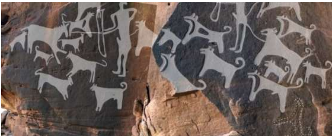
Figura 1 – Pinturas rupestres que mostram a relação de homens e animais encontradas em Shuwaymis e Jubbah, na Arábia Saudita.