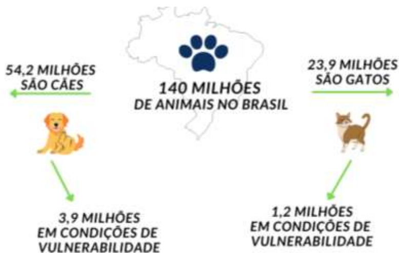
Figura 3: Infográfico de animais no Brasil

Apesar de não haver estatísticas oficiais, a Organização Mundial da Saúde (OMS) estima que mais de 30 milhões de cães e gatos estejam em situação de abandono morando nas ruas do Brasil, sendo 10 milhões de gatos e 20 milhões de cães.