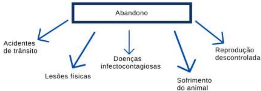
Figura 4: Consequências do abandono

consequências como riscos à saúde não só dos animais, mas também dos seres humanos, conhecidas como zoonoses.