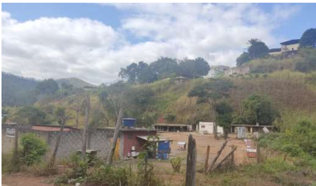
Figura 8: Local atual/instalações do canil

A área já conta com uma instalação que tem o intuito de servir de abrigo para os animais de rua, porém a estrutura atual não é adequada e além de não seguir as normas da vigilância sanitária, não oferece o mínimo adequado ao conforto, tanto para os animais quanto para os usuários.