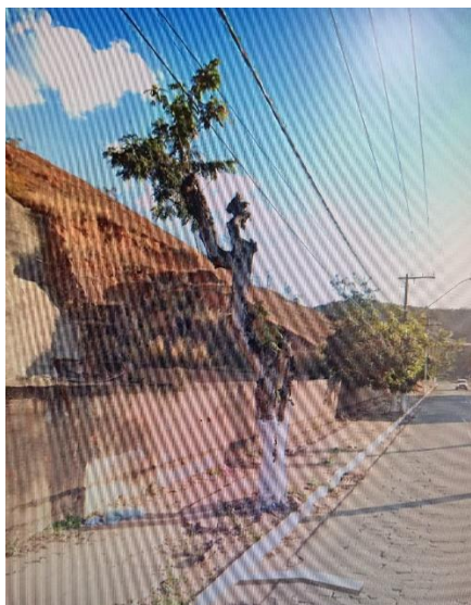
Foto 7-Poda drástica na avenida Adib Cadah