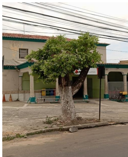
foto 8- Poda drástica na avenida Adib Cadah

Já com o plantio de espécies adequadas conseguimos uma melhora do bioma local, como também uma redução significativa financeira por parte concessionário que em poucos meses recuperara o que foi gasto e evitara podas futuras, melhorando a imagem da empresa junto a seus clientes, já a população vai encontrar no local arvores saudáveis e mais bonitas.