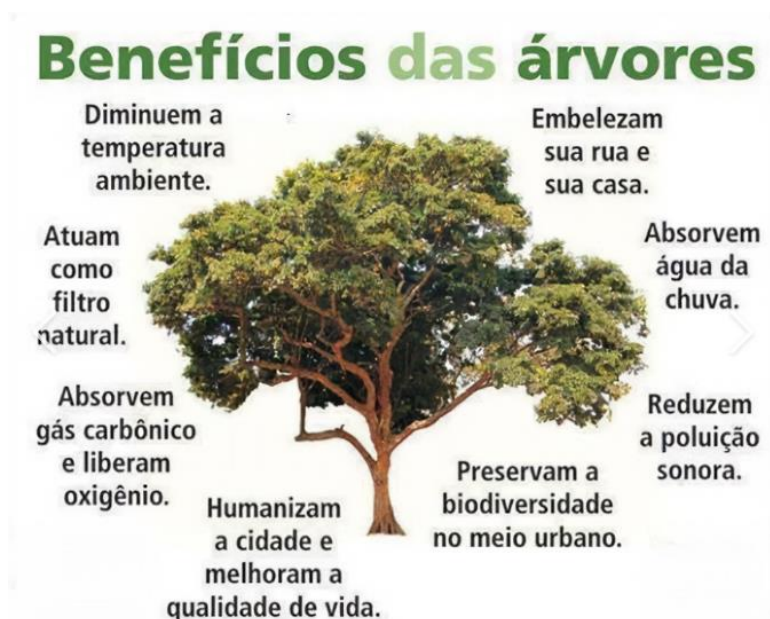
Foto3