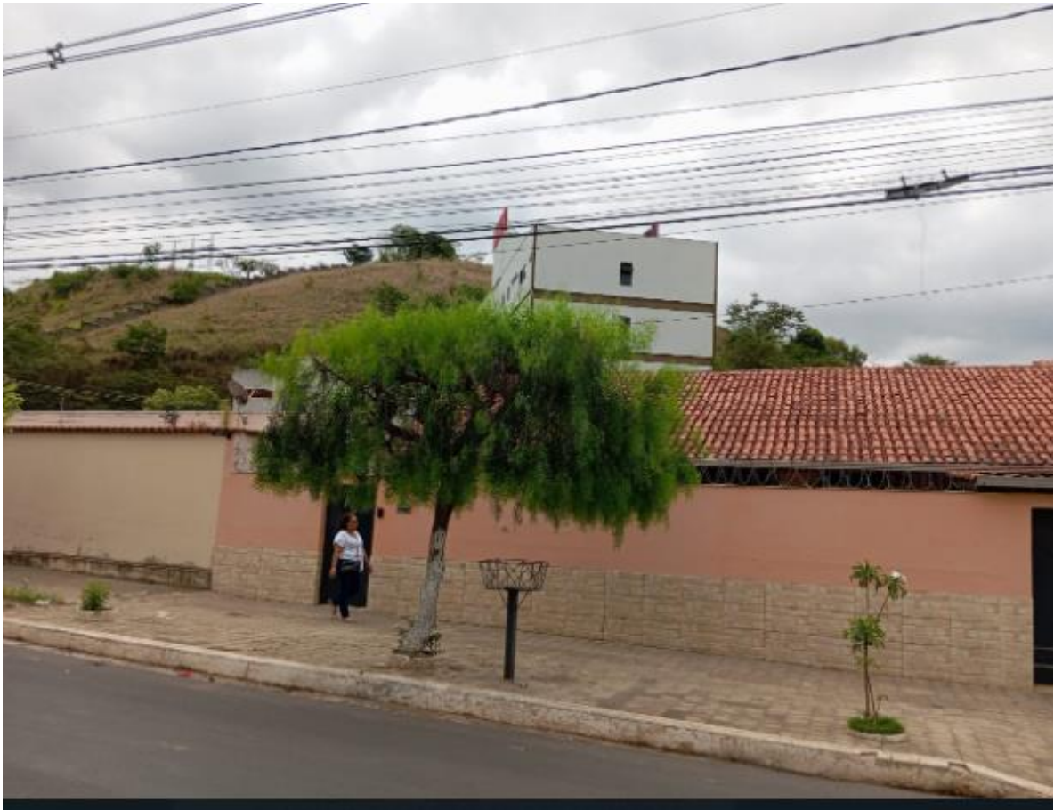
Foto 9- Av. Adibh cada com espécie correta de uma arvore de médio porte e outra recém plantada