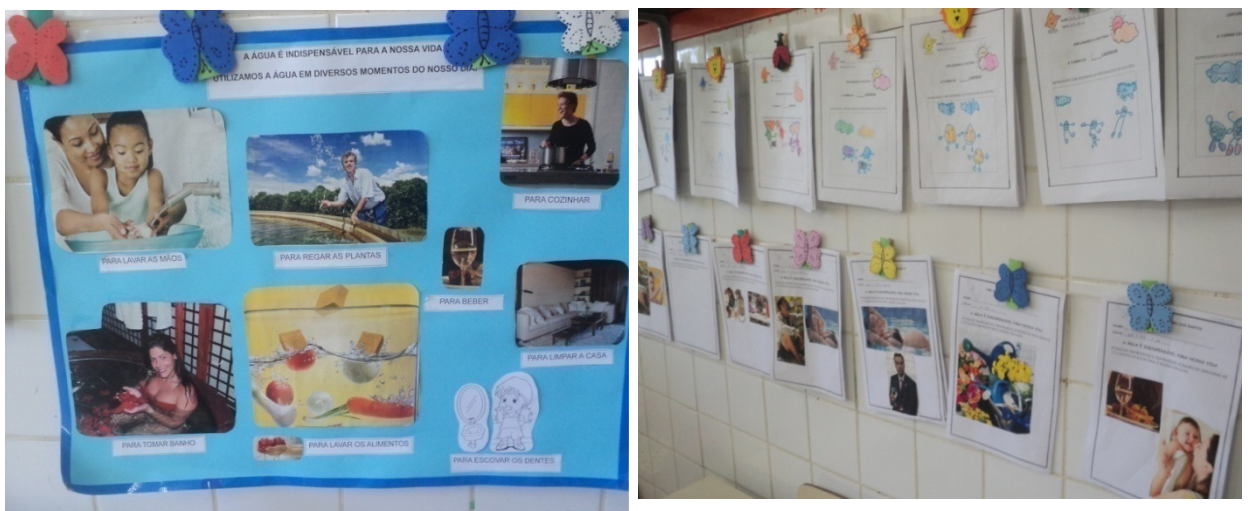
Foto 21/22, atividades trabalhada de acordo com o projeto

Atividades construída pelas crianças expostas em sala de aula.