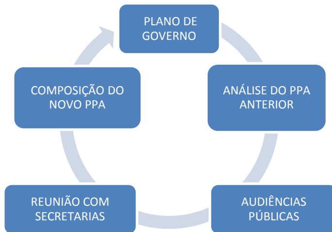
Figura1: ciclo orçamentário para composição do PPA/LDO/LOA do município da Serra

Após a votação, e definição do PPA / LDO / LOA o prefeito se reúne com as secretarias para expor como irá proceder em cada uma delas procurando atender a todas as demandas. Dentre as secretarias, vale ressaltar que duas delas tem foro privilegiado no que tange a utilização de receitas públicas, no caso a saúde com 15% e a educação 25% de toda arrecadação, esse privilégio está disposto no Artigo 212 e no Inciso II do Artigo 77 da constituição federal. Para que todo esse planejamento e toda essa estrutura criada resulte em melhoria no município é necessário que a previsão de arrecadação LOA, mencionada no PPA, seja no mínimo o que foi planejado e se possível além do planejado, caso contrário é pouco provável que os gestores consigam cumprir integralmente suas promessas de governo.