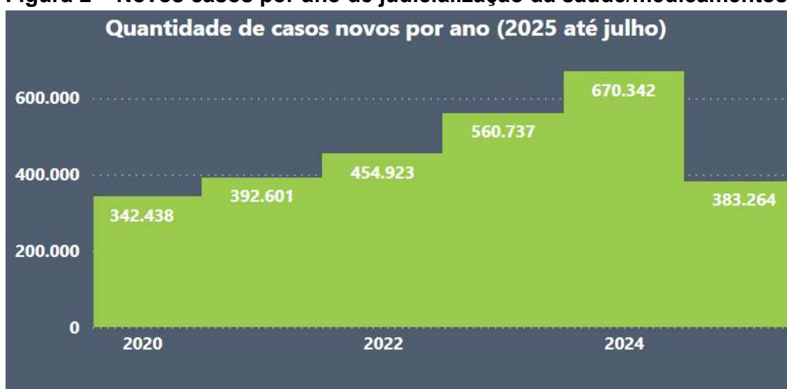
Figura 2 – Novos casos por ano de judicialização da saúde/medicamentos

Fonte: Gráfico do CNJ, Justiça em Números, 2025. 6