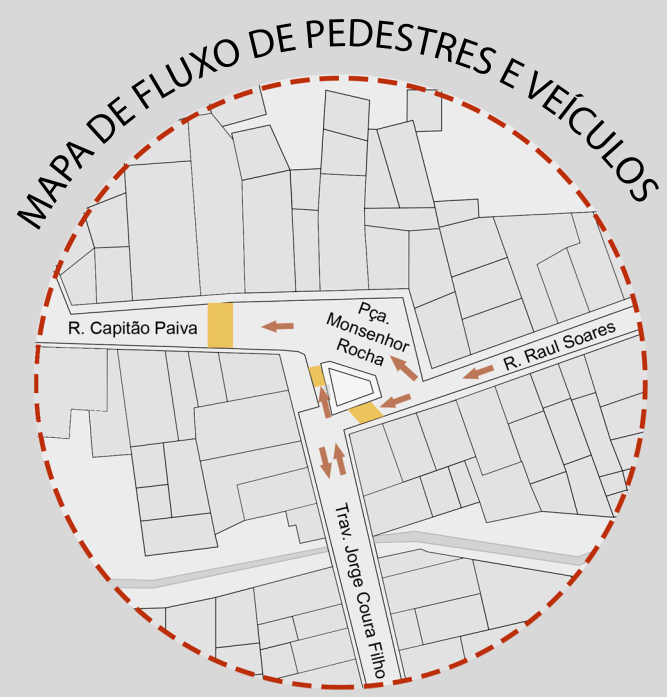
● Faixa de pedestre ● Fluxo de veículos

Movimentação intensa Ligação entre o centro da cidade e os bairros Muitas áreas ociosas Prioridade aos veículos