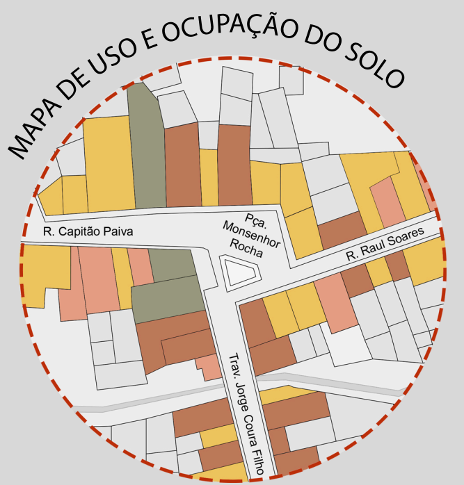
● Comercial ● Residencial ● Misto ● Institucional

Predominante 2 pavimentos Tendência à verticalização Diferentes formas de acesso Maior número de usuários