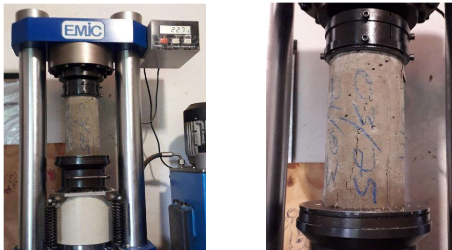
Figura 6 - Rompimento dos Corpos de Prova

Antes dos mesmos serem colocados em posição de ensaio, limpou-se e secou-se as faces dos pratos da máquina. Depois, colocou-se o corpo-de-prova no centro do prato, com o auxílio dos círculos concêntricos de referência que o prato inferior da máquina possui. Com isso iniciou-se o processo de rompimento dos corpos-de-prova, como segue a Figura 6. O acréscimo de cargas sob os corpos-de-prova só encerra quando se detecta uma queda no valor das cargas, indicando assim sua ruptura.