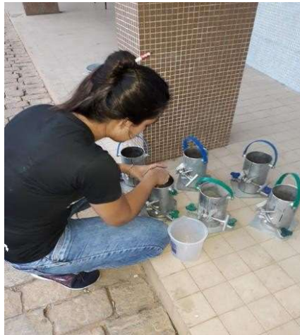
Figura 1 - Lubrificação das Formas dos Corpos de Prova

Antes iniciar-se o processo de produção do traço de concreto, foi necessário umedecer todos os equipamentos necessários para a sua produção e para o ensaio que foi realizado ainda com o concreto em seu estado fresco, o qual denomina ensaio de slump-test. Feito isso, lubrificou-se a parte interna e o fundo de todos os corpos-de-prova que foram utilizados para moldá-los, conforme a Figura 1.