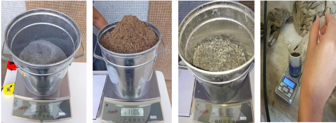
Figura 2 - Dosagem dos Materiais

dosados um a um conforme a tabela 1 e foram reservados até que todos estivessem dosados e permitindo assim dar início na mistura dos mesmos.