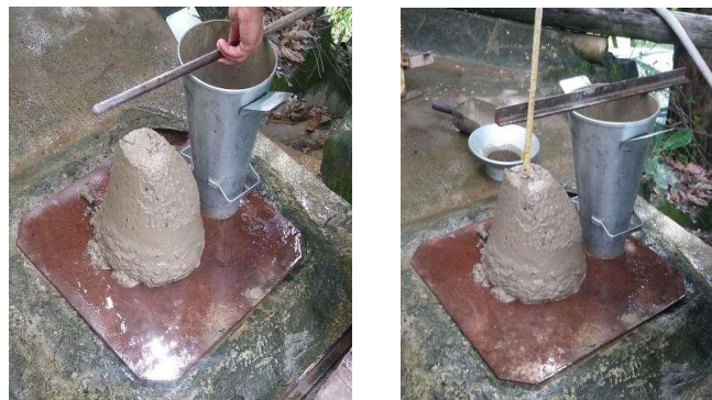
Figura 7 - Resultado Slump Test , (a): Traço Convencional; (b): Traço Aditivo

Analisando os resultados obtidos nos dois traços é notório a semelhança do assentamento mesmo os traços possuindo materiais diferentes em sua composição, como segue a Figura 7. Por tanto, o uso de aditivo no concreto não compromete a trabalhabilidade da mistura.