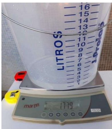
Figura 4 - Dosagem de Água

retido no recipiente, segue Figura 4, ligando a betoneira por mais 5 minutos para realizar a mistura dos materiais. Concluído esse tempo, adicionou-se o restante da água que havia ficado retida e misturou-se por mais 5 minutos.