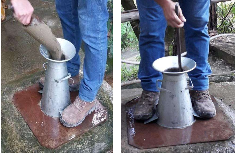
Figura 5 - Ensaio de Abatimento de Tronco de Cone

abatimento determinando a diferença entre a altura do molde e a altura do eixo do corpo-de-prova.