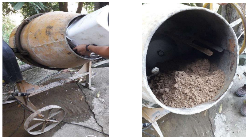
Figura 3 - Adição de Materiais na Betoneira

Deste modo, adicionou-se os materiais na betoneira um a um de forma decrescente, ou seja, começando pelo material que possui maior granulometria, como mostra a Figura 3, no caso o agregado graúdo, especificamente a brita 1 e 0. Em seguida, adicionou-se os agregados miúdos, que são a areia e o pó de pedra. Por fim, acrescentou-se o aglomerante, ou seja, o cimento. Antes de adicionar a água do traço à mistura, os materiais já adicionados à betoneira passaram pelo processo de homogeneização. Neste processo, a betoneira misturou todos os materiais durante o tempo de 30 segundos.