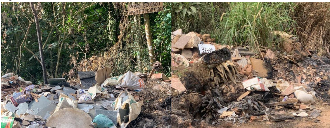
Figura 1: Descarte Inadequado dos RCC

O mesmo autor ainda ressalta que os resíduos da construção e demolição (RCC) dispostos de forma inadequada (Figura 1), resultam em graves problemas à gestão ambiental urbana, como o esgotamento de áreas de disposição final dos resíduos de forma prematura, a oclusão de elementos de drenagem urbana, sujeira nas vias públicas, a proliferação de insetos e roedores, resultando em um problema de saúde pública, o que traz prejuízos aos cofres públicos. (RIBEIRO, 2004).