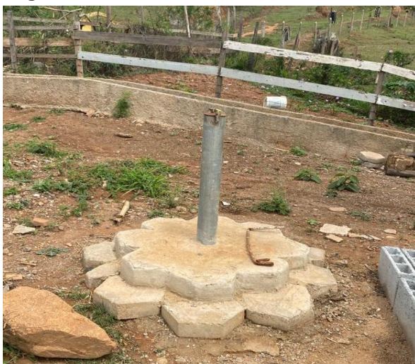
Figura 11: Ponto de coleta de amostra hídrica

Com o intuito de melhorar o padrão de qualidade da área, devido a existência de um manancial que vai adjacente ao descarte de resíduos, é coletado e analisado trimestralmente, por profissionais capacitados, uma amostra de água (Figura 11), tendo por objetivo o monitoramento dos os fatores de especificidade como o pH, alcalinidade e outros, dado ao processo de lixiviação que prejudica as propriedades hídricas.