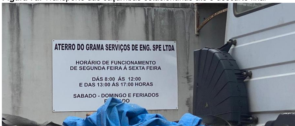
Figura 7a: Transporte das caçambas estacionárias até o descarte final

Segundo informado, não há registros da quantidade exata de resíduos que são recebidos, mas em média são 40 caçambas por dia, resultando no total de 200 m 3 de RCC diários.