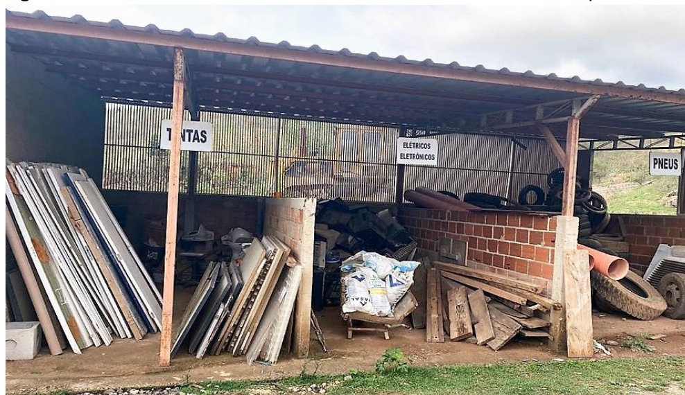
Figura 8: Local de acondicionamento final dos resíduos – materiais reaproveitáveis

Quando chegam ao local de acondicionamento momentâneo, o resíduo transportado pelas caçambas, passa pelo processo de rastelação, processo este que analisa se existe a possibilidade de reutilizar ou doar itens como pneus, latas de tintas, materiais eletrônicos, entre outros. Estes materiais reutilizáveis ficam armazenados em locais separados (Figura 8).