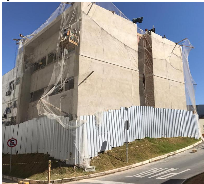
Figura 4: Santa Casa de Misericórdia de Juiz de Fora