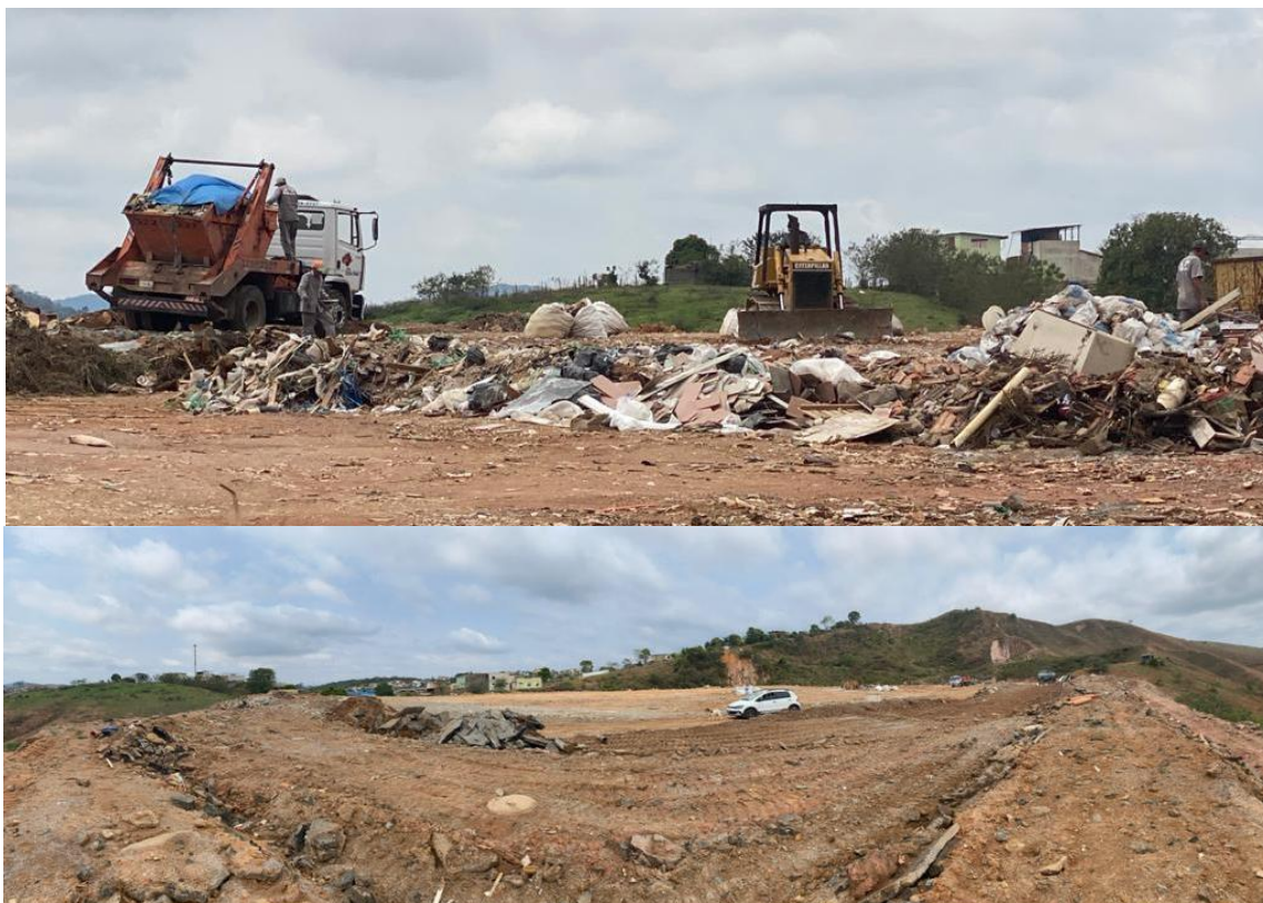
Figura 9: Local de compactação de RCC

Porém, deste local, verificou-se a existência de produtos descartados indevidamente, como mostra a figura 10 onde se encontram garrafas pets, madeiras, sacos plásticos, entre outros. Tal fato mostrou que existe uma preocupação com a separação dos materiais possíveis de aproveitamento, mas não no refino do RCC, sendo possível a identificação de outras classes de resíduos no local de compactação não somente resíduos de classe A e inertes como determina o Manual de Licenciamento elaborado pelo Ministério do Meio Ambiente.