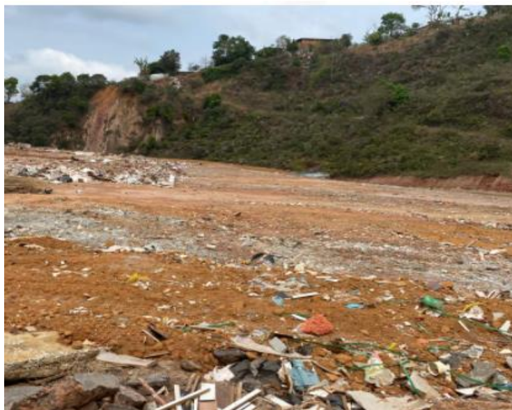
Figura 10: Local de compactação de RCC – descarte indevido