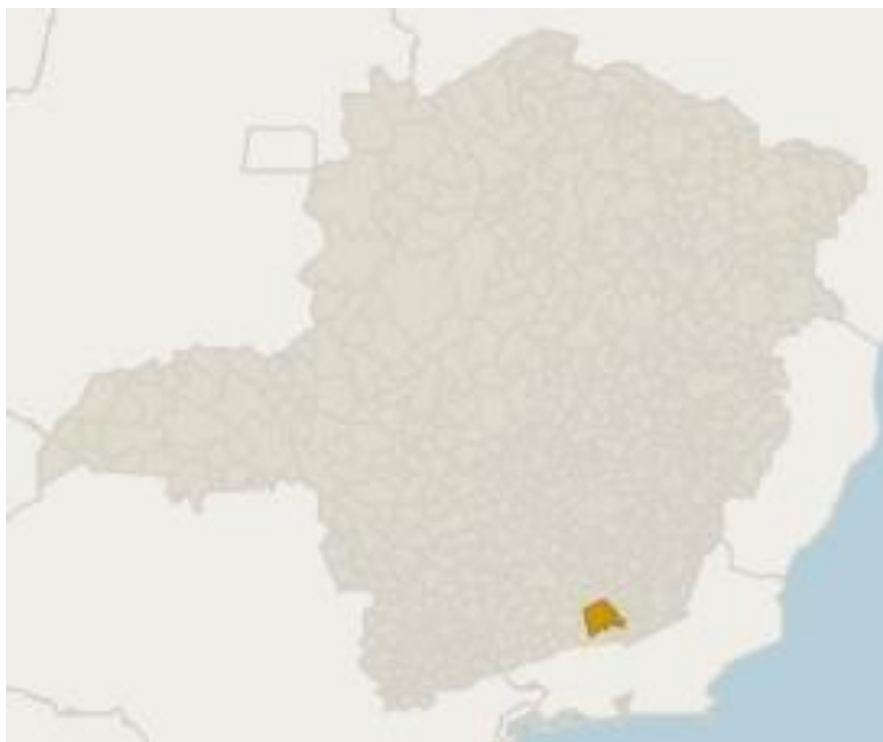
Figura 3: Local de estudo de caso de gerenciamento de RCC