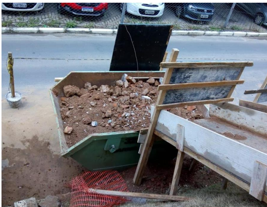
Figura 5: Caçambas estacionárias dentro do pátio.