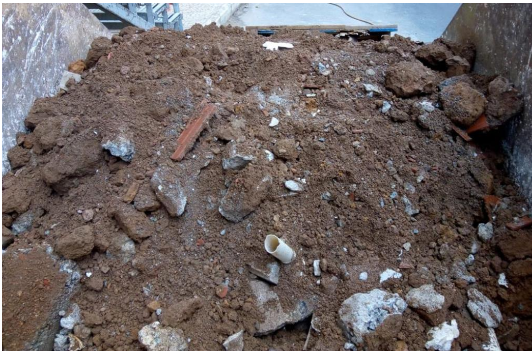
Figura 6: Caçambas estacionárias contendo os RCC.