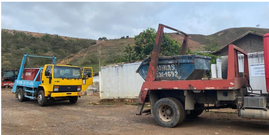
Figura 7b: Transporte das caçambas estacionárias até o descarte final