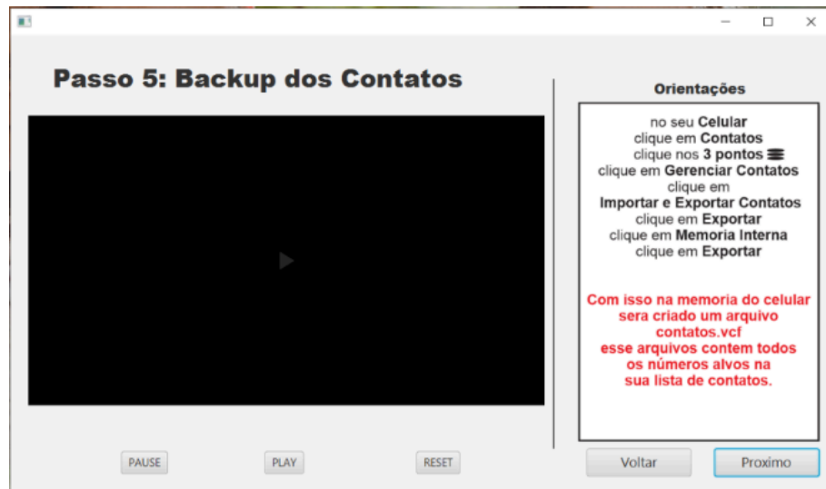
FIGURA 6 – Tela Backup dos Contatos