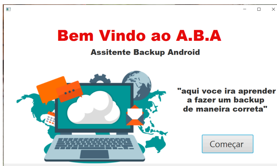
FIGURA 1 – Tela Inicial do Programa

Agora iremos verificar os resultados da pesquisa, apresentarei aqui as telas do aplicativo assim como a lógica por traz de cada página, como também as funções de cada parte do programa.