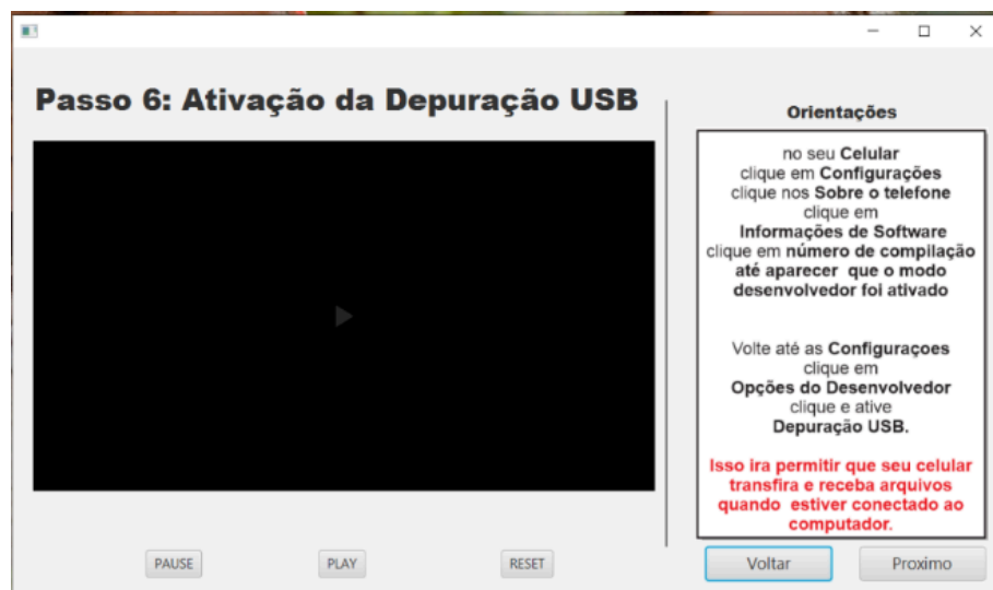
FIGURA 7 – Tela Ativação da Depuração USB

Aqui ensino o usuário a criar um arquivo .csv que um arquivo que contém toda a lista de contatos do usuário, esse arquivo pode ser enviado para outros usuários, e será utilizado para restaurar seus contatos após a formatação.