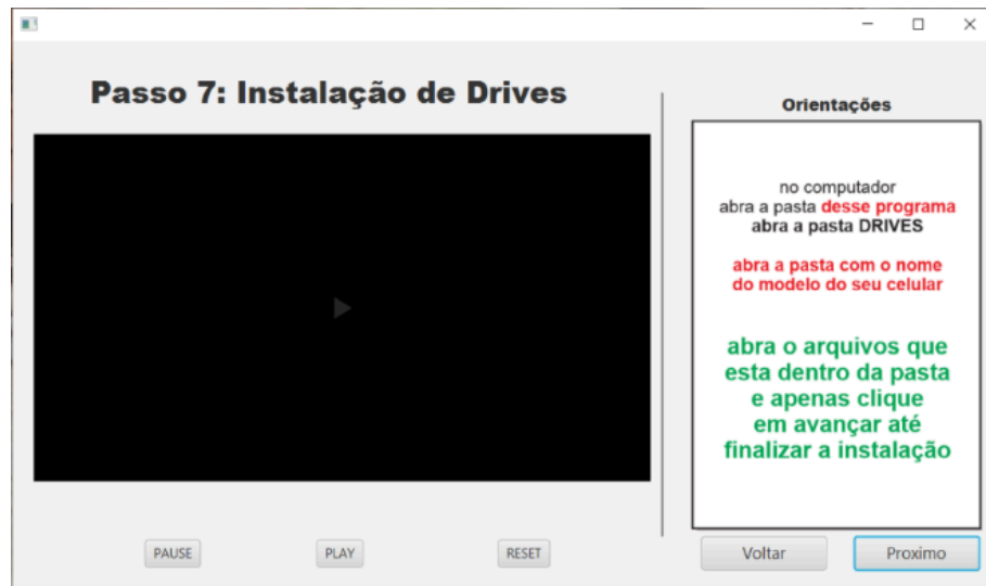
FIGURA 8 – Tela de Instalação de Drives