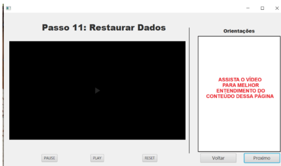
FIGURA 12 – Tela Restauração