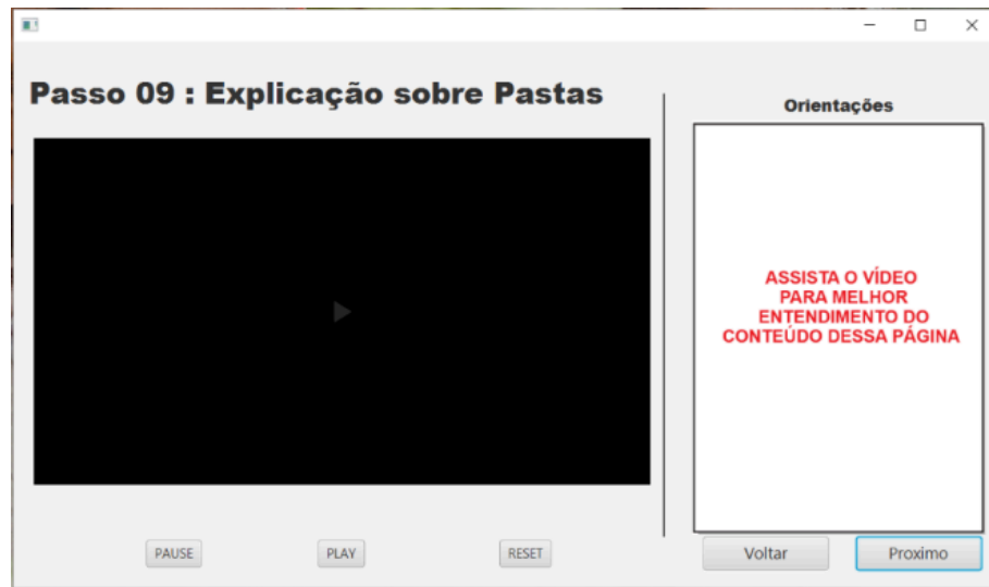
FIGURA 10 – Tela Explicação sobre as Pastas