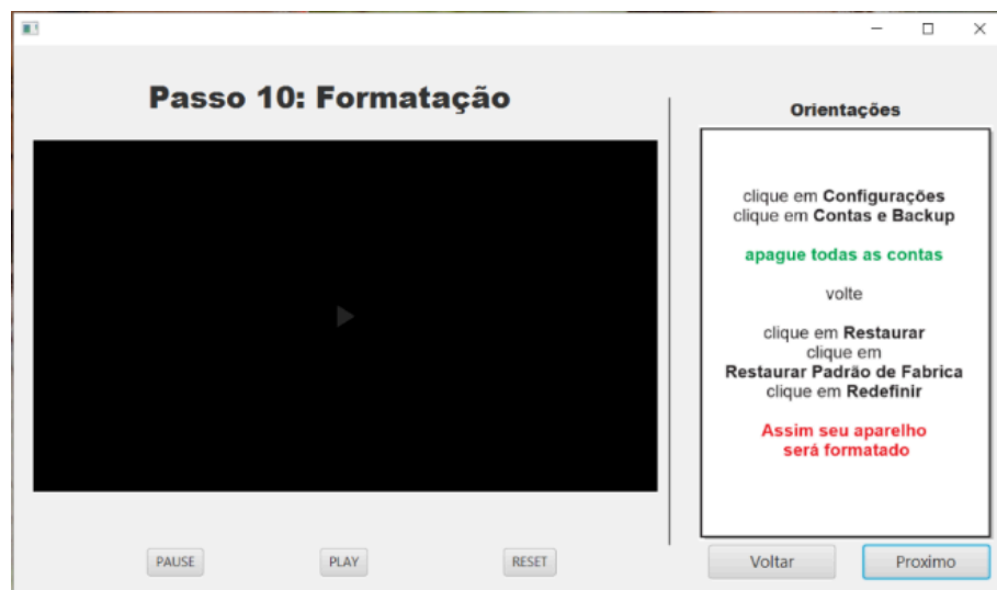
FIGURA 11 – Tela Formatação

Aqui ensino ao usuário o que cada pasta representa, e onde ele poderá encontrar seus arquivos de vídeo, musica, fotos e documentos, além do seu arquivo de backup dos contatos.