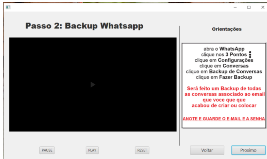
FIGURA 3 – Tela Conta do WhatsApp