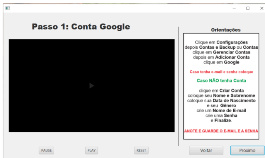
FIGURA 2 – Tela Conta Google

Esse aqui e a primeira tela do programa nela e apenas uma tela inicial simples do programa. Possuem apenas um botão para começar a assistir o passo a passo.