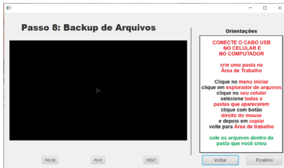
FIGURA 9 – Tela Backup de Arquivos

Aqui explicou ao usuário sobre a instalação dos drives do modelo e marca do seu aparelho, o que é necessário para permitir ao computador reconhecer o celular do usuário que será conectado através de um cabo usb.